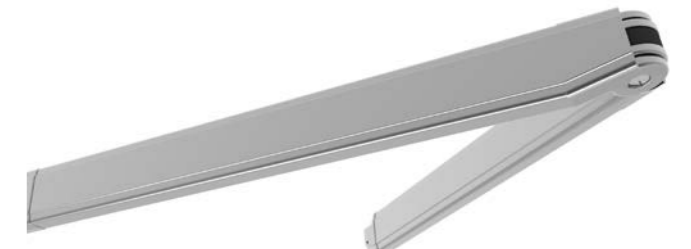
Gelenkarm Top 80

für AREIA 7040 bis 3000 mm Ausfall (ausgenommen Varioplus-Rollo oder LED) bei CLEO 5530 Standard (nicht mit LED möglich)