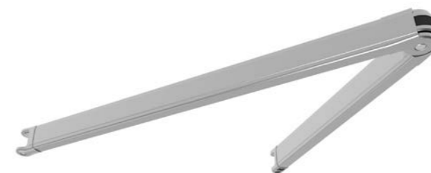
Gelenkarm Top 50

für AREIA 7040 bis 3000 mm Ausfall (ausgenommen Varioplus-Rollo oder LED) bei CLEO 5530 Standard (nicht mit LED möglich)